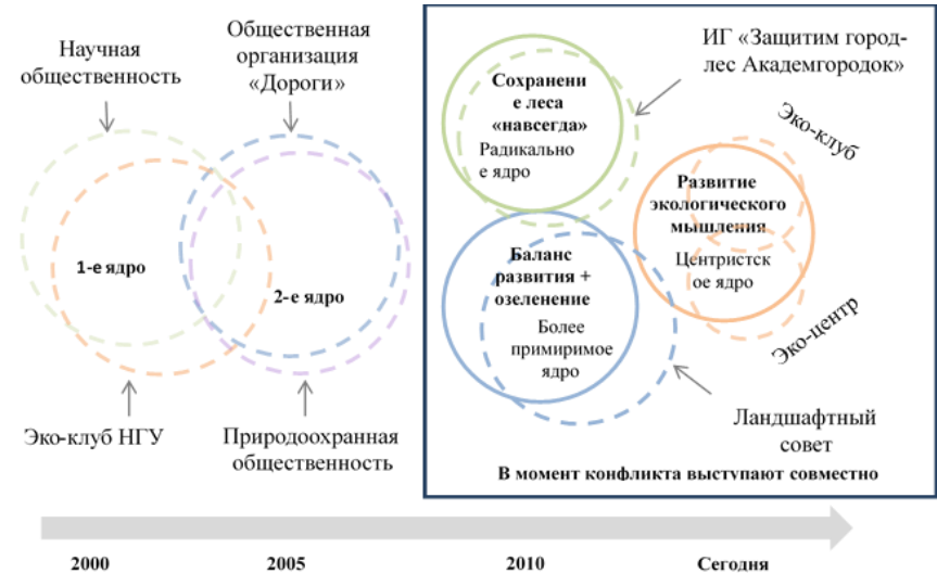
ОС на основе динамики изменений сетевой репрезентаций конкретного сообщества