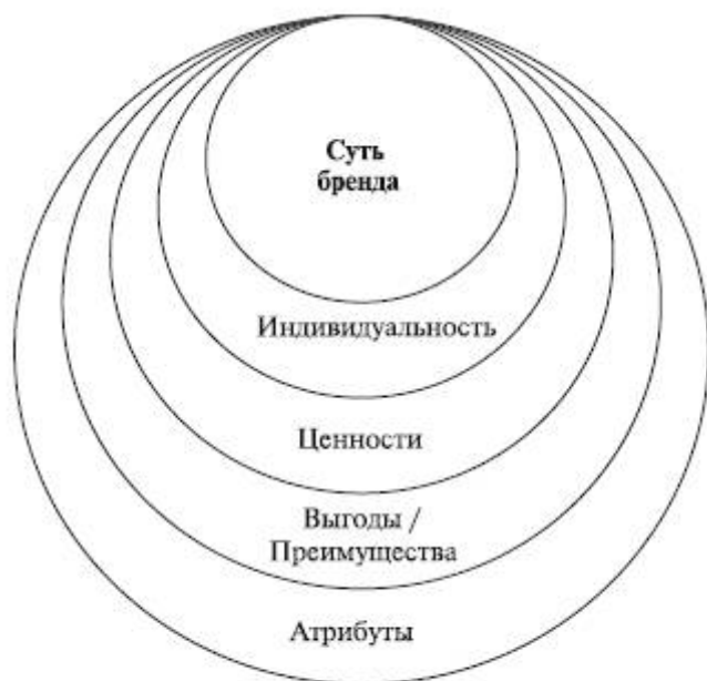
Рис. 2. «Колесо бренда»

Создание имени бренда является его важнейшим коммуникатором, интегрирующим все главные идеи и положения, кратко и точно выражающим его суть. В долгосрочном периоде имя формирует стратегический потенциал бренда, поэтому к его выбору необходимо подходить особенно тщательно. Грамотно разработанное имя бренда точно и содержательно указывает на категорию, определяющую бренд, и его ассоциации (позиционирование бренда, назначение товара, ценовая категория, контекст потребления и др.). Имя бренда должно соответствовать требованиям русского языка, этики и морали. Принципиальное значение такое требование приобретает в случае вывода бренда на международные рынки. В мировой практике брендинга существуют различные методики разработки эффективных имен брендов. Вместе с тем можно выделить основные направления анализа, включающие шесть последовательных этапов: